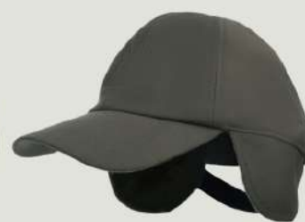
CAP OLIVE GREEN