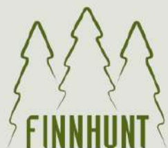
ТАБЛИЦА РАЗМЕРОВ МУЖСКИХ КУРТОК FINNHUNT CM