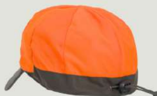
HAT OLIVE GREEN

Состав: верх 100% полиэстер, утеплитель 100% полиэстер подкладка 100% полиэстер